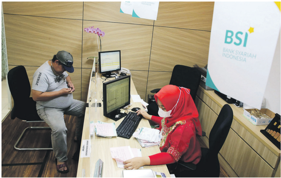
LAYANAN BSI - Pegawai melayani nasabah di Bank Syariah Indonesia (BSI) usai peresmian di Makassar, Senin (1/2/2021). Presiden Joko Widodo meresmikan BSI yang menandai telah tuntas dan rampungnya proses merger tiga bank syariah milik Himbara yakni PT Bank BRISyariah, PT Bank Syariah Mandiri dan PT Bank BNI Syariah.